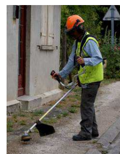
Débroussailleuse à fil