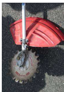
Débroussailleuse à lames réciproques

Pour l'enherbement semé, il est important de choisir des semis de végétaux résistants au piétinement et à la sécheresse.