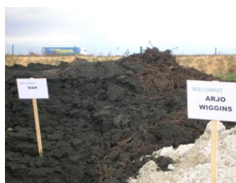
Plate-forme de compostage rustique (Cerneux)