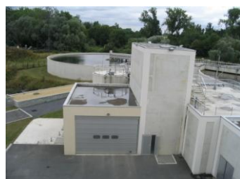
Vue sur le bâtiment abritant le sécheur thermique (Villeparisis)