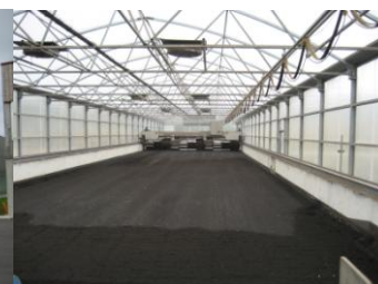
Serre solaire avec retourneur (Bourron Marlotte)