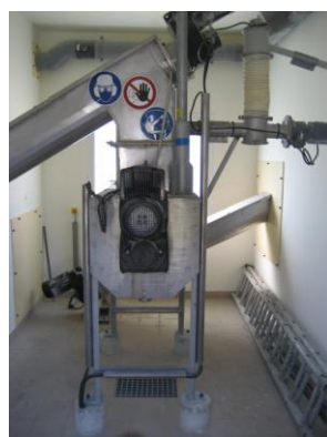
Malaxeur à chaux (Grisy Suisnes)