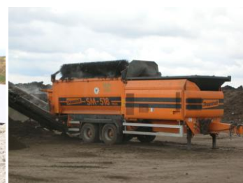
Criblage du compost (Cerneux)