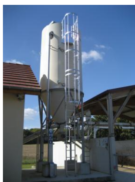
Silo à chaux vive (Grisy Suisnes)