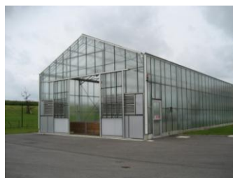
Serre solaire (Saint Souplets)