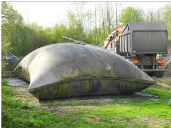
Poche trop remplie