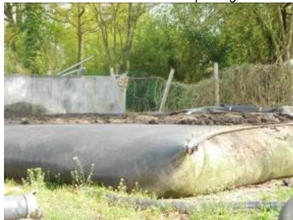
Boues en cours d'enlèvement avec ouverture de la poche

Les boues après floculation sont envoyées dans des poches filtrantes qui concentrent les boues. Ces poches sont habituellement placées au sein d'un lit de séchage existant et les filtrats peu chargés en Matières en suspensions (MES) percolent à travers le lit puis retournent en tête de la station d'épuration. Les poches sont ensuite ouvertes et les boues récupérées au tractopelle. La siccité obtenue devrait se situer entre 15 et 25 % de MS pour des boues urbaines selon le fournisseur.