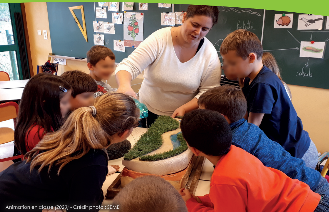
Animation en classe (2020) - Crédit photo : SEME