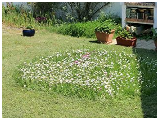
Tonte différenciée, créant un massif de pâquerettes

Si vous souhaitez éviter l'installation de végétation spontanée dans votre pelouse, favorisez sa compétitivité en tondant haut, en apportant du compost au printemps, et en rénovant la pelouse à l'automne. Vous pouvez utiliser un couteau à désherber pour déloger les touffes de vivaces qui vous semblent inesthétiques. Cependant, pourquoi ne pas accepter tout simplement la présence de trèfle, pâquerettes, violettes et autres pissenlits ? Ils apportent une note fleurie et permettent aux insectes butineurs de se nourrir.