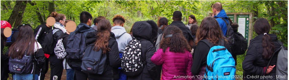
Animation "Collège Nature" (2020)