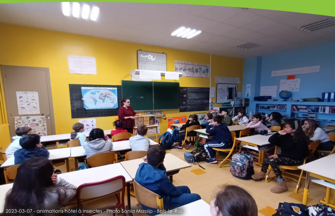
2023-03-07 - animations hôtel à insectes - Bois-le-Roi