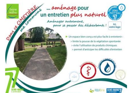
Exemple de panneau fourni aux communes recevant le Trophée « ZÉRO PHYT'Eau »

La communication doit se faire envers les services communaux pour une meilleure mise en application des nouveaux dispositifs d'entretien et envers le grand public afin d'accompagner et de faire connaître la démarche.