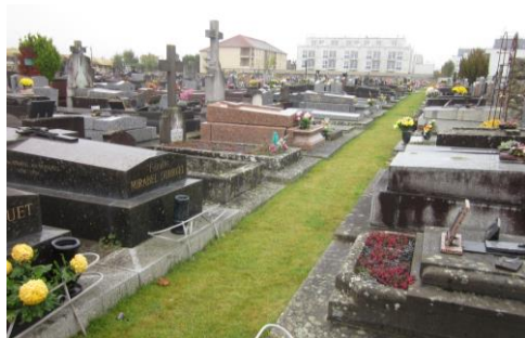
Allée enherbée Pontault-Combault

Il conviendra de privilégier les aménagements perméables pour favoriser une gestion des eaux pluviales par infiltration et limiter l'artificialisation des sols.