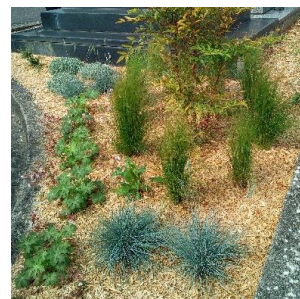
Plantation de vivaces Lagny-sur-Marne