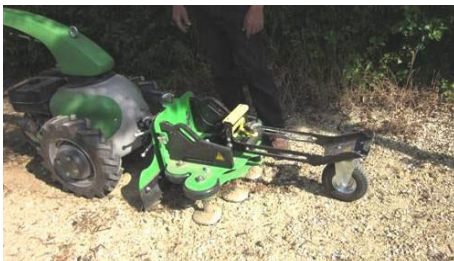
Rabot sur motoculteur

NB : Les matériels tractés ne sont pas présentés car ils présentent les mêmes caractéristiques que leurs homologues non tractés, et ne concernent potentiellement que les cimetières de grande taille.