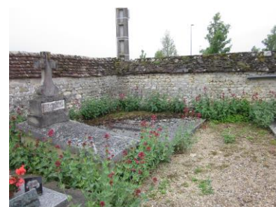
Acceptation de valérianes présentes spontanément Beaumont-du-Gâtinais

Par exemple la cymbalaire des murailles ( Cymbalaria muralis ), l'orpin acre ( Sedum acre ), le coquelicot ( Papaver rhoeas )... sont des plantes intéressantes parfois présentes naturellement dans les cimetières seine-et-marnais.