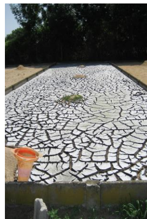
Lit rempli de boues séchées

Constructeurs en Seine et Marne : Entreprise PAGOT, RTP, SARL POISSON et tous les constructeurs de stations d'épuration.