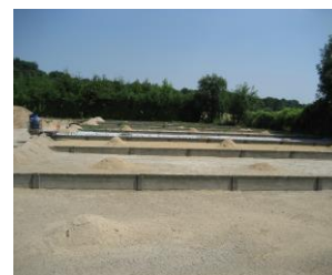
Lits de séchage vides de boues