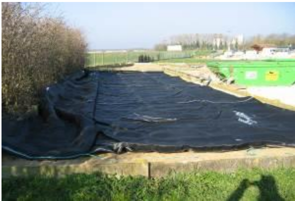
Poche en cours d'installation