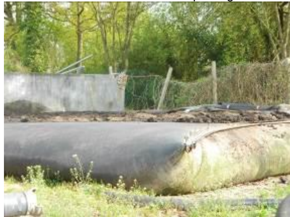
Boues en cours d'enlèvement avec ouverture de la poche

Les boues après floculation sont envoyées dans des poches filtrantes qui concentrent les boues. Ces poches sont habituellement placées au sein d'un lit de séchage existant et les filtrats peu chargés en Matières en suspensions (MES) percolent à travers le lit puis retournent en tête de la station d'épuration. Les poches sont ensuite ouvertes et les boues récupérées au tractopelle. La siccité obtenue devrait se situer entre 15 et 25 % de MS pour des boues urbaines selon le fournisseur.