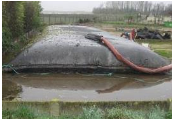
Poche en cours de remplissage