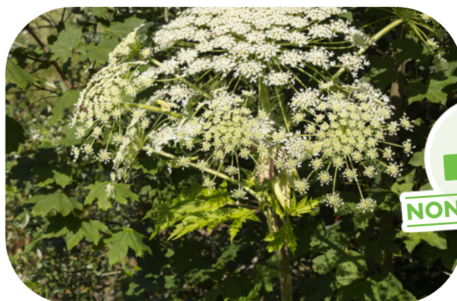
Berce commune ( Heracleum sphondylium )

La berce commune ne dépasse pas 2 m. Les tiges, pétioles et folioles portent des poils blancs, rêches et n'ont pas de tâches. Les ombelles possèdent 15 à 30 rayons. La berce commune n'est pas dangereuse. Elle est assez petite jusqu'à 2 m alors que la berce du Caucase fait de 3 à 4 m par conséquent si la plante est bien plus grande que vous, c'est de la berce du Caucase !