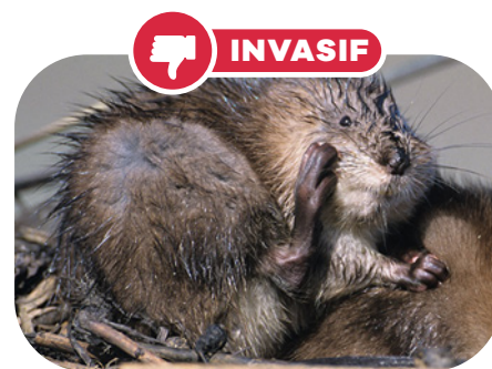
Rat musqué 24 à 30 cm (sans la queue) 0,6 à 2 kg