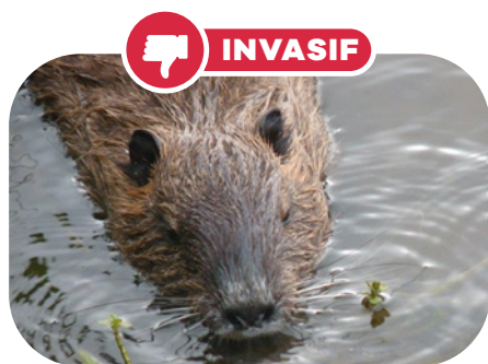
Ragondin 40 à 60 cm (sans la queue) 4 à 10 kg