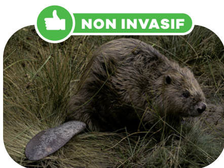
Castor espèce protégée : 1 à 1,2 m de long 20 à 25 kg