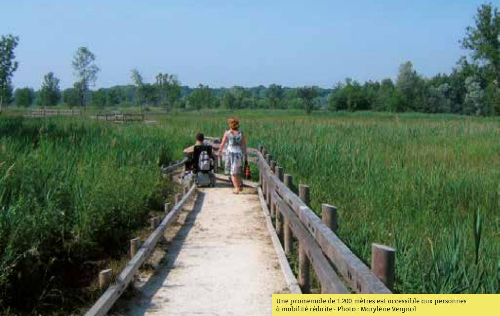
Une promenade de 1 200 mètres est accessible aux personnes à mobilité réduite