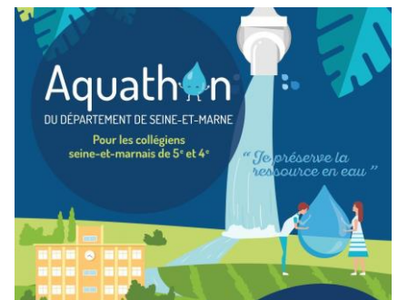
Affiche AQUATHON – CD77

Pour en savoir plus vous pouvez nous contacter à l'adresse suivante : clara.humeau@departement77.fr