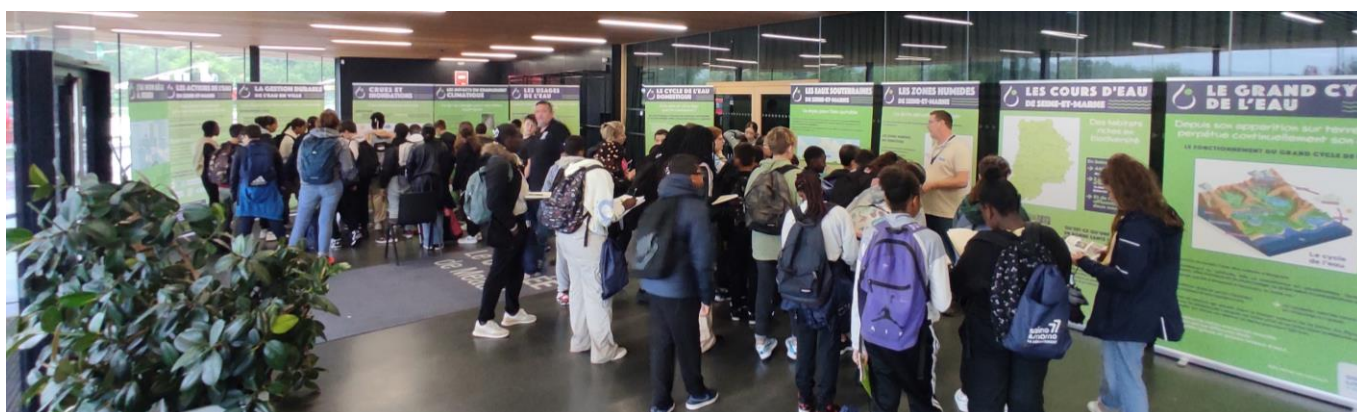
Présentation de l'EXP'O 77 lors du Forum Départemental de l'Eau - 2023

https://eau.seine-et-marne.fr/fr/exposition-expo-77