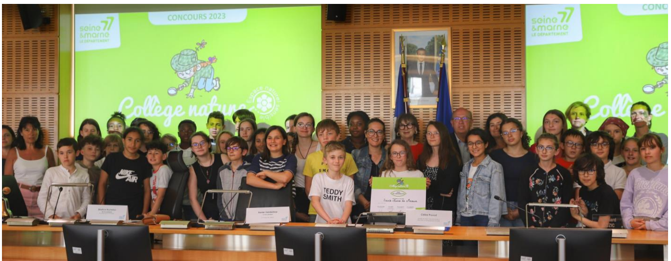
Trophées « Collège Nature » 2023, collège Sainte Marie de Meaux