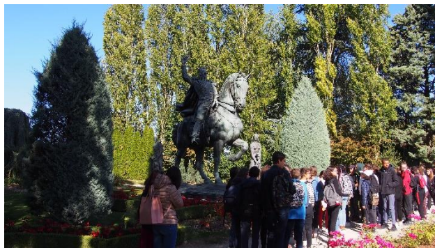
Collège Madeleine Renaud au musée Bourdelle (2019)

Les animations scolaires proposées par chaque musée sont listées sur leurs sites respectifs. Vous les retrouverez également dans le livret « Parcours Collégien » les animations proposées aux collèves : https://www.seine-et-marne.fr/fr/parcours-collegien