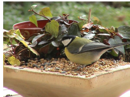
Mésange charbonnière se nourrissant sur une mangeoire

Plus d'informations : https://www.vigienature-ecole.fr/