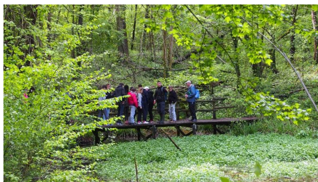
Collège Madeleine Renaud à l'ENS des Bordes Challonges (2019)

Visite gratuite sur demande pour les collèges publics seine-et-marnais, en fonction des disponibilités. Contact : lda77@departement77.fr , 01 64 14 76 56