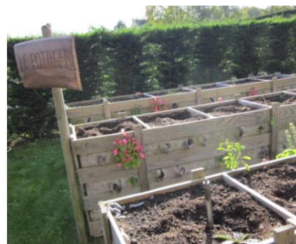
Potager en bacs pour les écoles – Melun

Découvrez des conseils de jardinage au naturel dans la rubrique « Eco-gestes et jardinage au naturel » sur https://eau.seine-et-marne.fr/ et dans le guide des écogestes au jardin ( https://eau.seine-et-marne.fr/fr/publications/guide-eco-gestes-au-jardin-2022 )