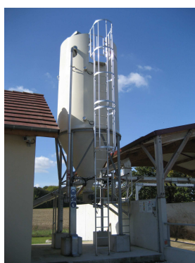
Silo à chaux vive (Grisy-Suisnes)