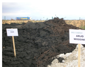
Plate-forme de compostage rustique (Cerneux)