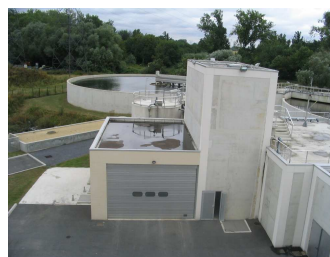
Vue sur le bâtiment abritant le sécheur thermique (Villeparisis)