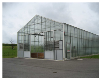
Serre solaire (Saint-Soupplets)