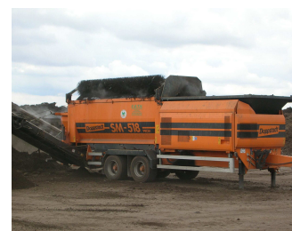
Criblage du compost (Cerneux)