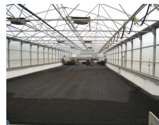
Serre solaire avec retourneur (Bourron-Marlotte)