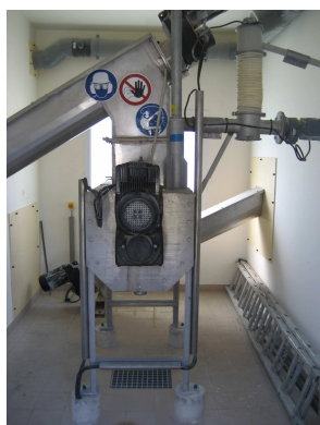
Malaxeur à chaux (Grisy-Suisnes)