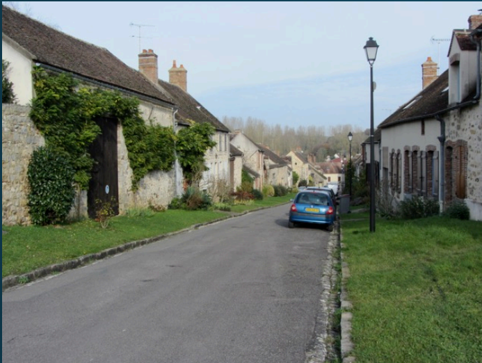
VIRONS DE MONTEBEAU — Flagy (S.-&-M.)